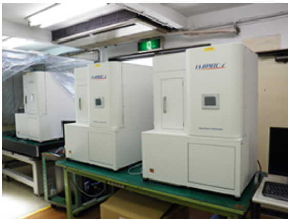
薬事製品製造ライン