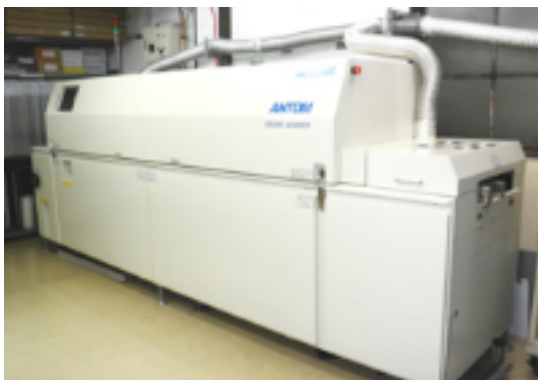
鉛フリー対応リフロー

製造部門内ではあらゆる分野の製品の組立～完成まで承っております。 プリント基板実装、ケーブルハーネス加工等単品でも承っております。